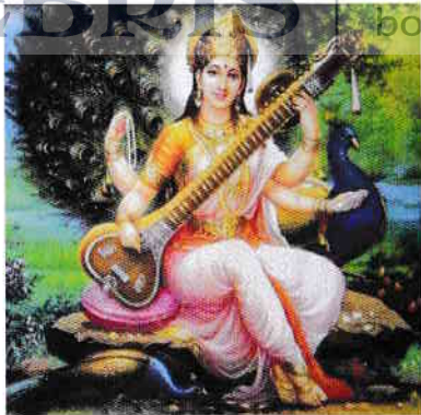
Zeita Saraswati soția zeului Brahma