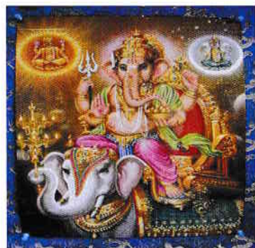
Ganesha (cu cap de elefant)