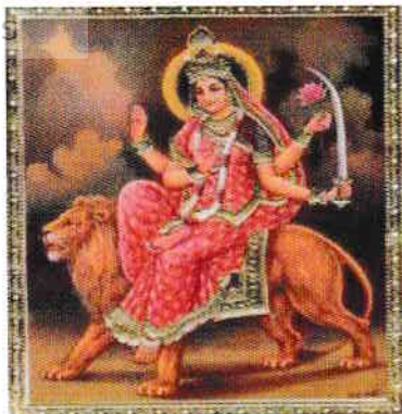
Zeita Parvati (Durga-Kali- Amba-Shri) soția lui Shiwa