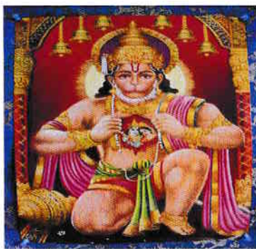
Hanuma (cu gura de leu)

Hinduismul nu promovează idolatria, dimpotrivă, această religie încurajează transcendența fizicului în progresul spiritual. Această religie „cere” oamenilor să practice credința prin idoli reprezentați cu trăsături fizice, ca mai apoi să poată ajunge să vizualizeze divinitatea fără ajutorul idolilor sau a templelor. Deci, se „cere” nu adorarea idolilor, ci adorarea Divinului, care ia forma idolilor. (Un mare învățat indian, Swami Vivekananda spunea: „Oamenii au nevoie de idoli care reprezintă Divinitatea, pentru că prin intermediul idolilor oamenii înțeleg divinitatea” ).